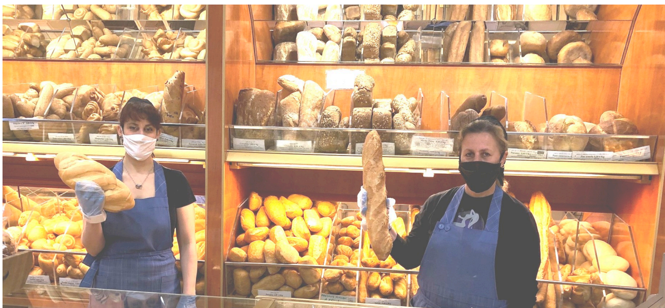
Mascherina, guanti e distanziamento: così si lavora oggi in panificio

DAL 18 MAGGIO RIAPERTURE GENERALIZZATE MA ATTENTI ALLE REGOLE